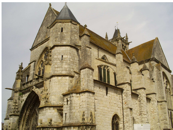
Notre Dame de Moret – mai 2009

Sisley s'inspire de Claude Monet qui avait réalisé 10 motifs de la cathédrale de Rouen