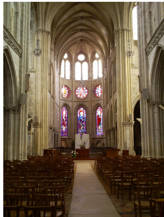
Le Chœur - museonature - mai 2009

Dans la même place, à l'angle de la rue Grez, se trouve l'ancien Hospice des religieuses où l'on fabriquait des sucres d'orges.