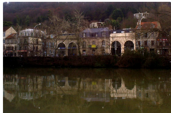
museonature - janvier 2010