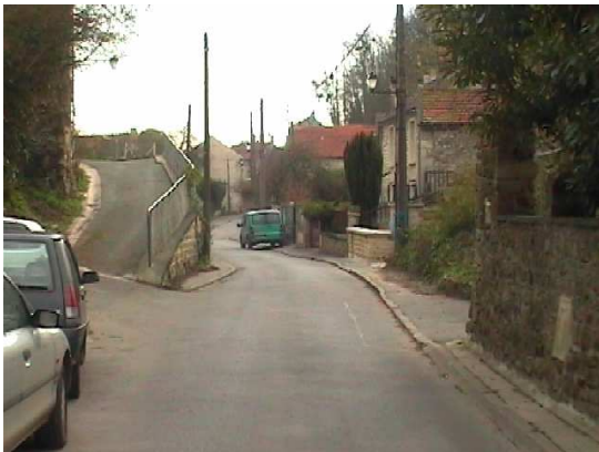
La rue du Valhermeil

Sur la gauche, la Sente des Jardins. Pour la réalisation de ce tableau, Victor VIGNON a installé un chevalet dans la rue du Valhermeil, à hauteur des N° 33 ou 35. Les maisons sont situées le long de la rue du Valhermeil, facilement reconnaissables.