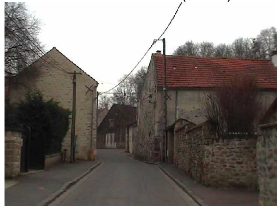
Centre du tableau (Détail)

Dans le détail ci-dessous, la maison de droite représente la chaumière du N° 17 présentée également dans les motifs de CEZANNE, PISSARRO et BOURGES