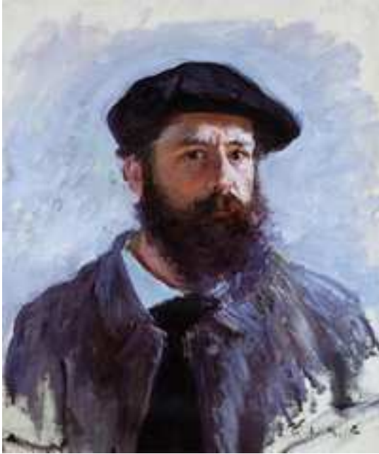
Portrait de Claude Monet

Vers 1870, Argenteuil est un "haut lieu de l'impressionnisme" et un lieu de rencontre pour les gens aimant la nature et les sports aquatiques.