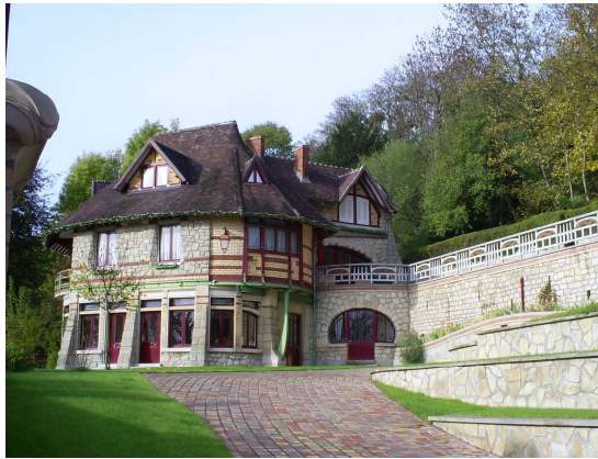
Photographie novembre 2006

Titre : CASTEL VAL 2 (1903) Site: Auvers sur Oise (Val d'Oise) France