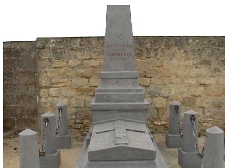
Photographie - février 2004

Site: Auvers sur Oise (Val d'Oise) France