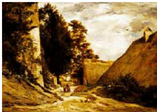
Motif représenté sur site

Artiste : Charles François DAUBIGNY 1 Titre : Route de village Technique: huile sur toile Site: Auvers sur Oise (Val d'Oise) France