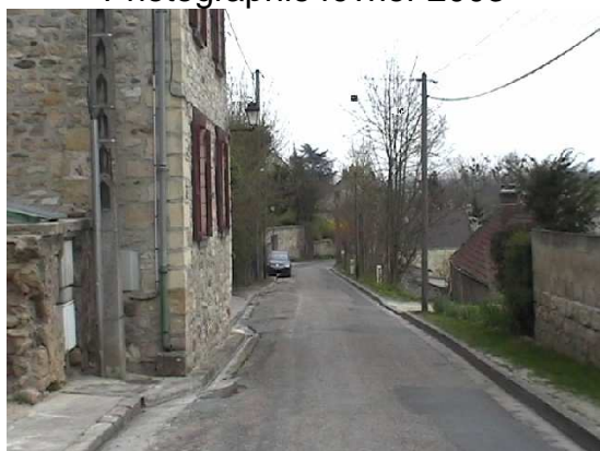
La rue des Ruelles

Après les Grès et la rue des Meulières vous arrivez très rapidement dans la rue des Ruelles. Au milieu de cette rue, vous remarquerez le motif de Charles - François Daubigny