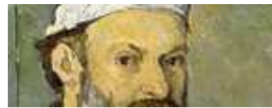
Paul Cézanne (détail)

Paul CEZANNE construit sa toile par touches successives de matière et de couleur.