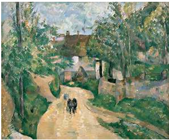
« La rue du Valhermeil »

Artiste : Paul Cézanne 8 Titre : La Route tournante à Auvers-sur-Oise (1881) Technique : Huile sur toile Dimensions : 60.3 x 73 cm Musée : Quinque Foundation, Providence Site : Auvers sur Oise. Hameau du Valhermeil, (Val d'Oise) France