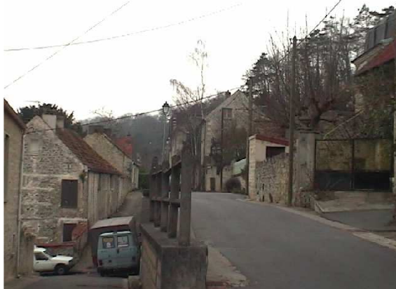
La rue François Coppée