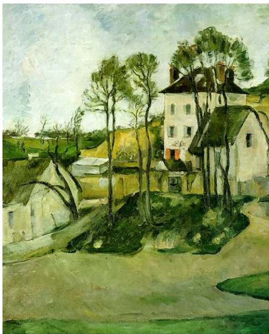
Motif non représenté sur site

Artiste : Paul CEZANNE 7 Titre : Maison du Docteur GACHET (1872) Musée: Kunstmuseum, Bale Technique: Huile sur toile Site: Auvers sur Oise (Val d'Oise) France