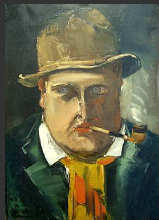
Auto Portrait (1912)