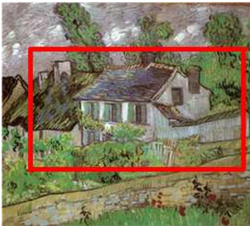
La Sente du Gré (Van Gogh juin 1890)