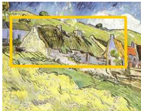
Les Chaumières (Van Gogh mai 1890)

Le hameau du Gré à Chaponval a inspiré plusieurs peintres de fin XIXe.