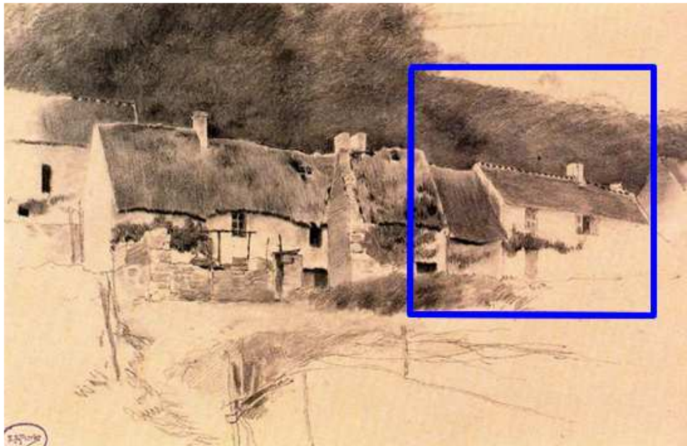
Emilio Sanchez Perrier : Le Hameau (1895)