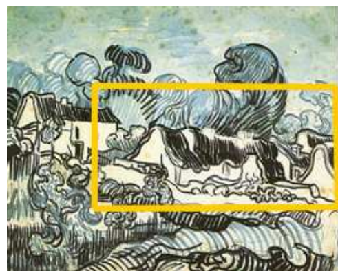
Paysage boisé (Vincent Van Gogh – mai 1890)

Ici, les premières œuvres de Vincent Van Gogh à Auvers sur Oise